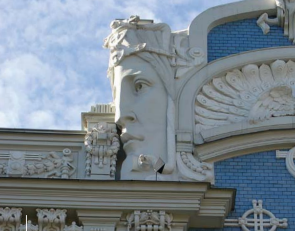
Adeilad art nouveau yn Riga.