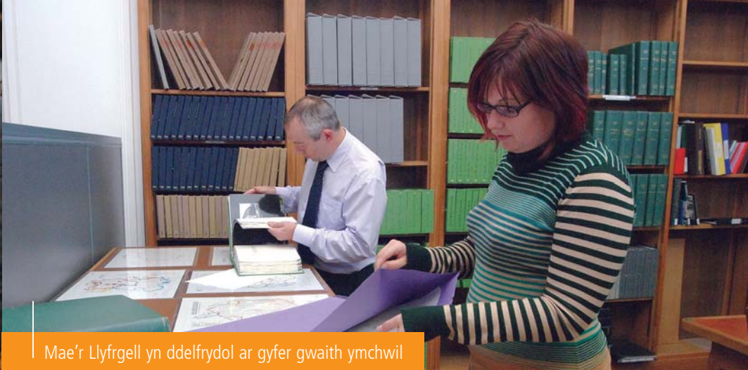
Mae'r Llyfrgell yn ddelfrydol ar gyfer gwaith ymchwil