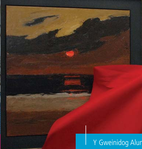
Y Gweinidog Alun Pugh yn dadorchuddio llun olew olaf Kyffin