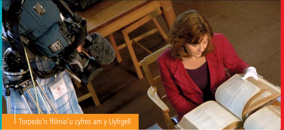
Torpedo'n ffilmio'u cyfres am y Llyfrgell