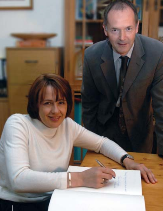
Tanni'n arwyddo'r Llyfr Ymwelwyr gyda'r Llyfrgellydd